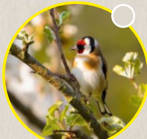
Le chardonneret élégant