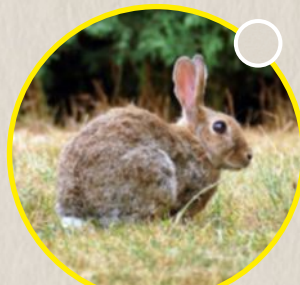
Le lapin de Garenne